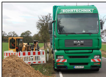
Tiefbauarbeiten mit einer HDD-Spülbohrmaschine auf der Hauptkabeltrasse Rietzmeck - Neeken