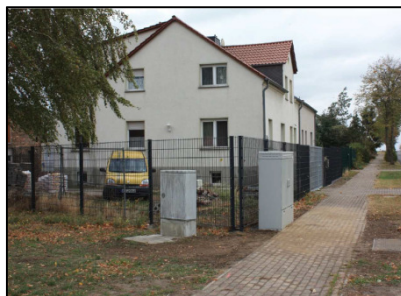
Multifunktionsgehäuse (MFG) der DATEL und Kabelverzweiger (KVZ) der Telekom in Neeken